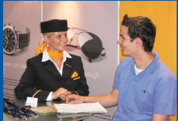
Beliebt: Beratung „auf gleicher Augenhöhe“. Zugleich eine Herausforderung für die jungen Ratgeber – Auszubildende und Studenten.