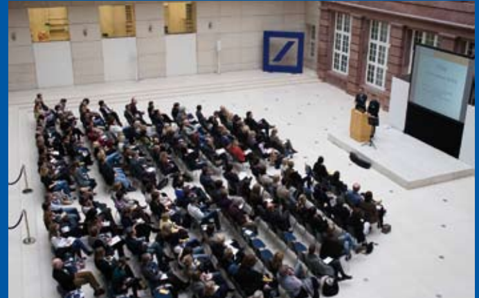
TALENTUM-Tagung Berlin 2011. Auch die ARD-Tagesschau berichtete darüber. Rechts: Grußwort von Bundestagsvizepräsident Eduard Oswald.