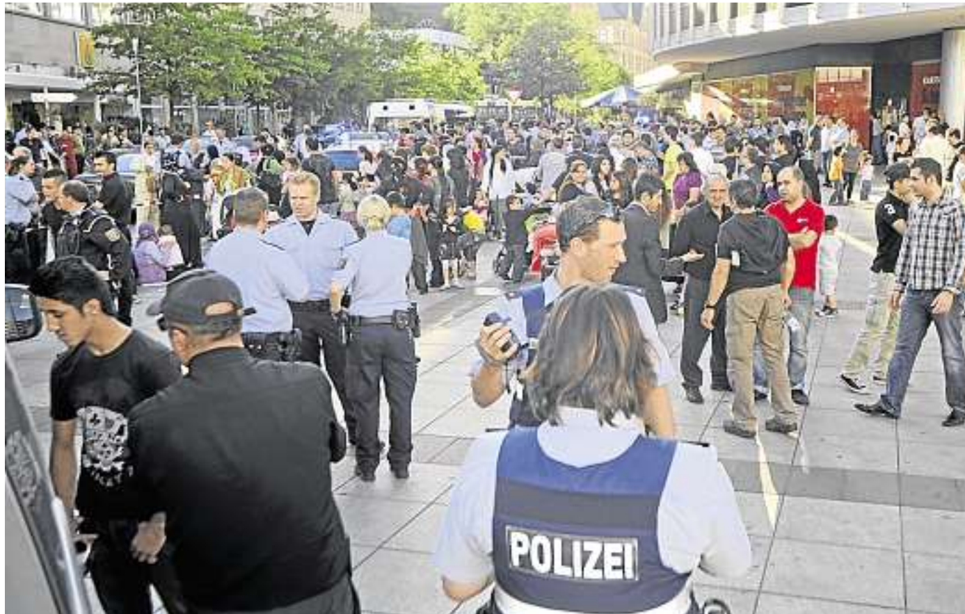
Am Berliner Platz in Ludwigshafen kesselte die Polizei am Mittwochabend die Teilnehmer der Demonstration ein.

Nach Angaben des Polizeipräsidiums Rheinpfalz war die Versammlung mit rund 200 Teilnehmern genehmigt. Der kurdische Kulturverein betonte ges-